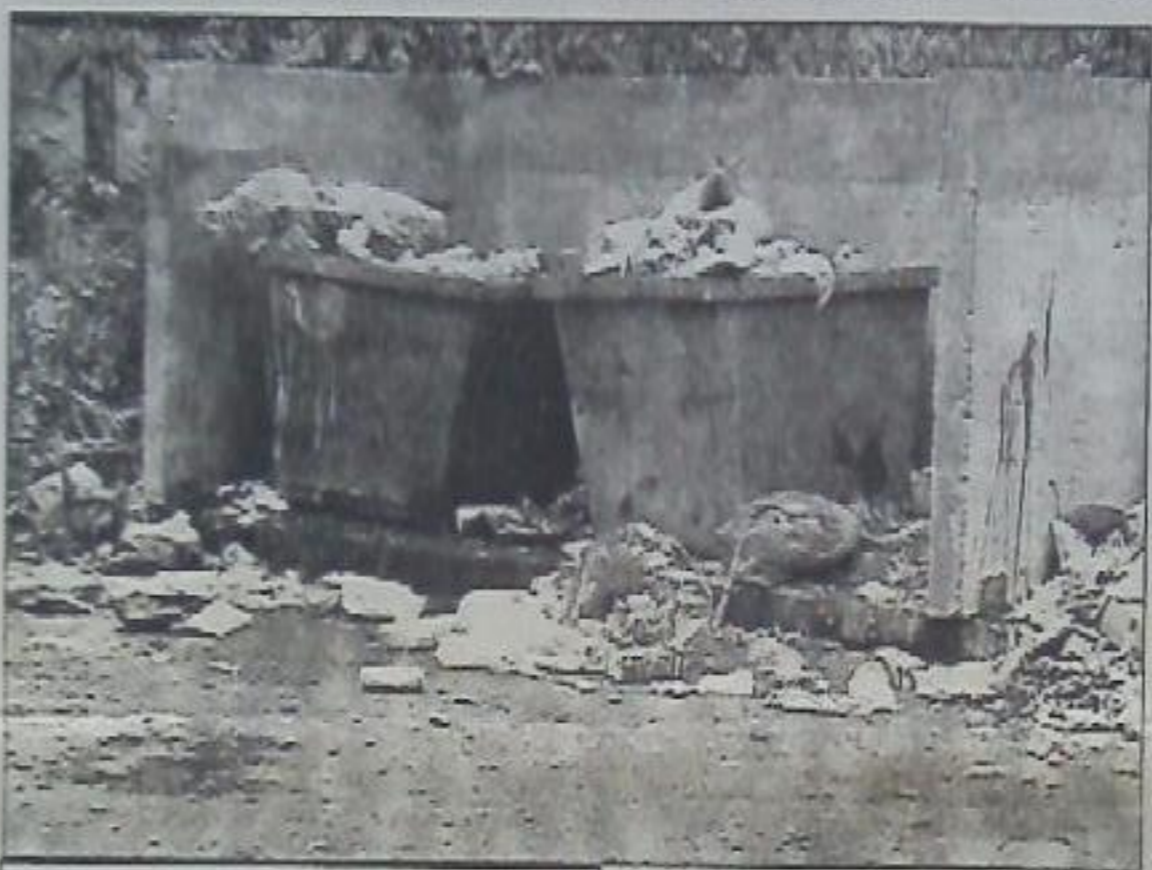
Фотофакт. Без комментариев.

Хочется дать совет жителям – вспомнить старый добрый метод наших прабабушек: органические отходы превращать на своём огороде в прекрасное удобрение – компост. В правильных компостных ямах создаётся термический эффект, и все микроорганизмы погибают. И очень хочется, чтобы власти, на которые законом возложены обязанности по вывозу и переработке отходов, делали это правильно, соблюдая все положенные нормы.