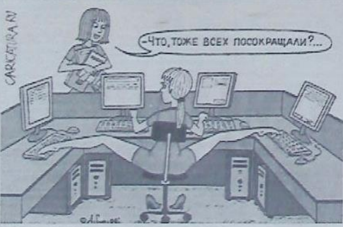
Ничего не поделаешь: финансовый кризис...