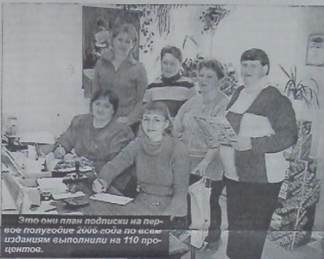
Это они план подписки на первое полугодие 2006 года по всем изданиям выполнили на 110 процентов.