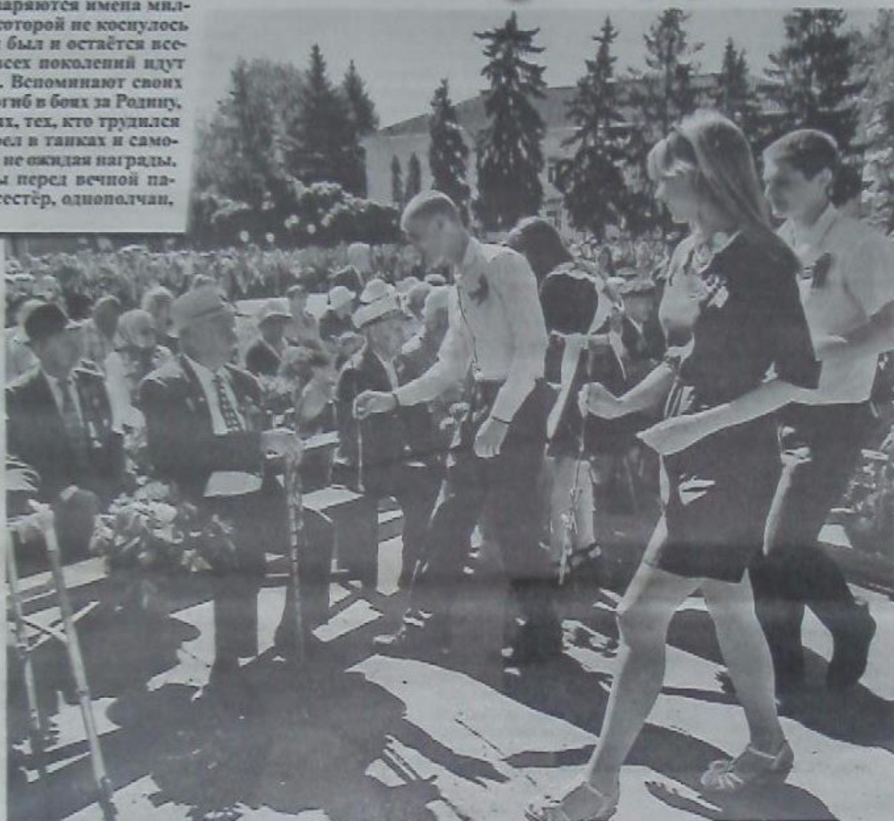
Идут годы, сменяются десятилетия, но этому подвигу – подвигу народа в Отечественной войне – суждено навсегда остаться в истории. Чтобы дети только играли в войну, никогда не слышали вой сирен, не гибли под бомбежками, выстояли и победили наши деды и прадеды.