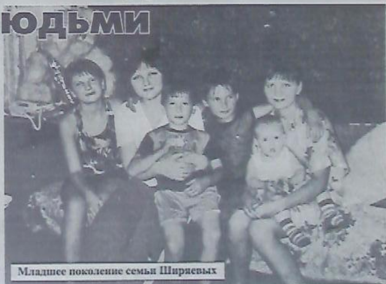
Младшее поколение семьи Ширяевых

Мама научила своих детей не только готовить и заботиться друг о друге, но и рукодельничать. Сама она с детства увлекалась плетением и вязанием. Поначалу куклы обшивала, потом дочерей: