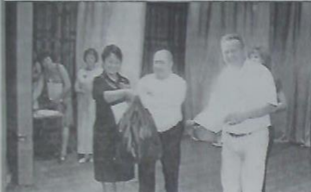
Все радуются: спортивная форма Марьинской школы явно не помешает.

И пятый безусловный приоритет – забота о здоровье школьников. Тут важно наращивать базу для занятий спортом, пробудить в самих детях желание заботиться о своём здоровье. Мощный резерв – организация правильного питания.