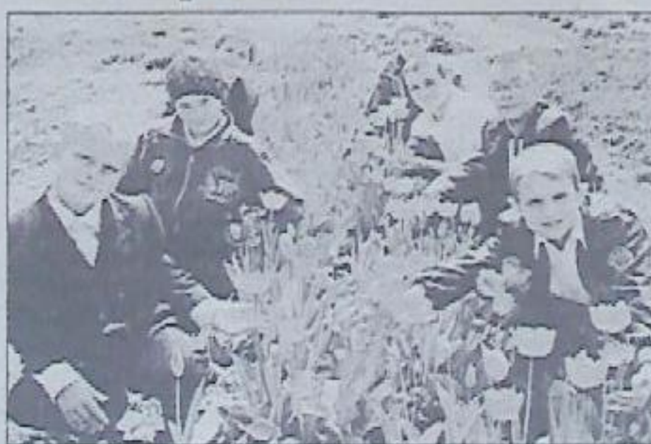
Украстить землю цветами – значит украсить ее любовью.

На нашем пришкольном участке настоящий цветочный рай! Каких тут только цветов не встретишь! Розы всех оттенков цветут на клумбах перед зданием школы. Ранней весной радуют глаз тюльпаны, нарциссы, гиацинты, а в мае распускаются нежные кустики пионов, душистая сирень, бархатные ирисы, красные головки маков. Только шагнет лето на порог – загорятся солнышки ромашек, чуть слышно на ветру звенят колокола белоснежных лилий, разноцветным ковром цветут цинния, петунья, сальвия, гадания. А осенью пестрят поляны махровых астр, лучистых георгин, ярких дубков. Как же приятно любоваться цветочной сказкой! Радуют глаз хрустящие создания природы и с любовью выращенные нашими трудолюбивыми руками. Цветочно-декоративный отдел – гордость участка! На нем мы и работаем с удовольствием, и отдыхаем, наблюдая, фотографируя удивительный мир цветов.