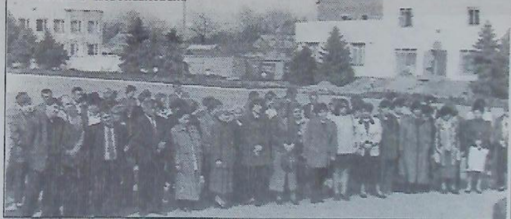
Митинг в Новопапавловске

принимаемых губернатором по обеспечению безопасности на территории края, прошли в станицах Старопапавловской, Зольской, Марьянской, Советской, селе Горнозаводском.